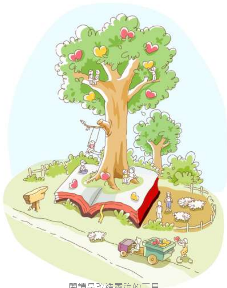
閱讀是改造靈魂的工具