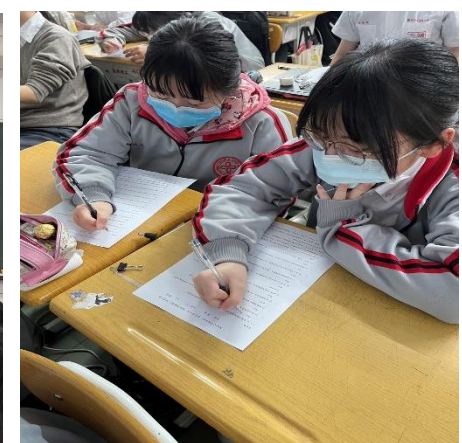
校內課堂宣導兒少性剝削議題