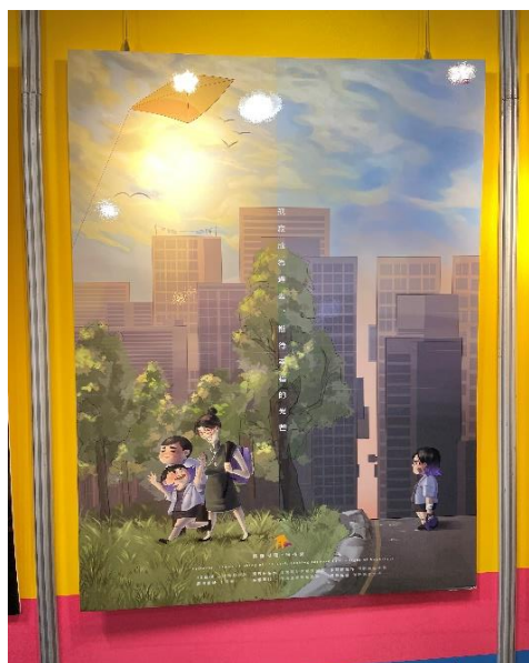
元旦展-學生製作預防家庭暴力的主題