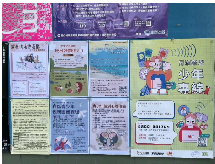
輔導處布告欄宣導家庭教育相關資訊