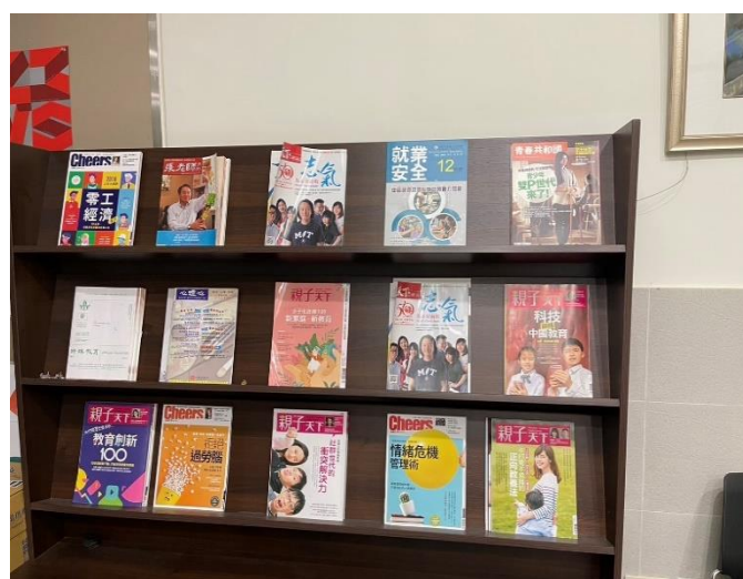
團體諮商室-家庭教育刊物書籍