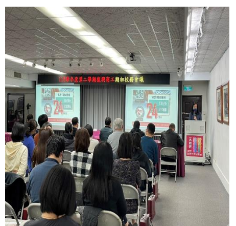
輔導主任於校務會議宣導兒少性剝削議題