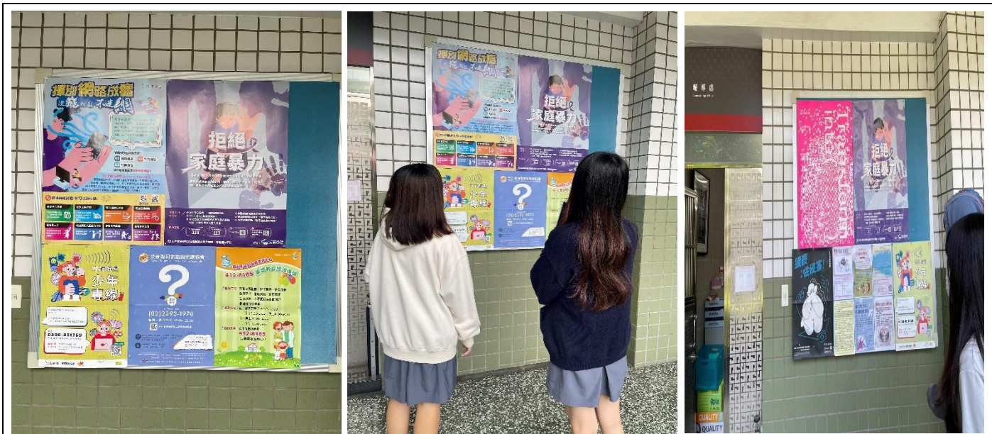
輔導處布告欄宣導家庭教育相關資訊