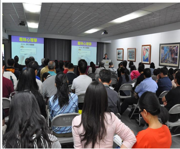
人性趣味心理學與盲點