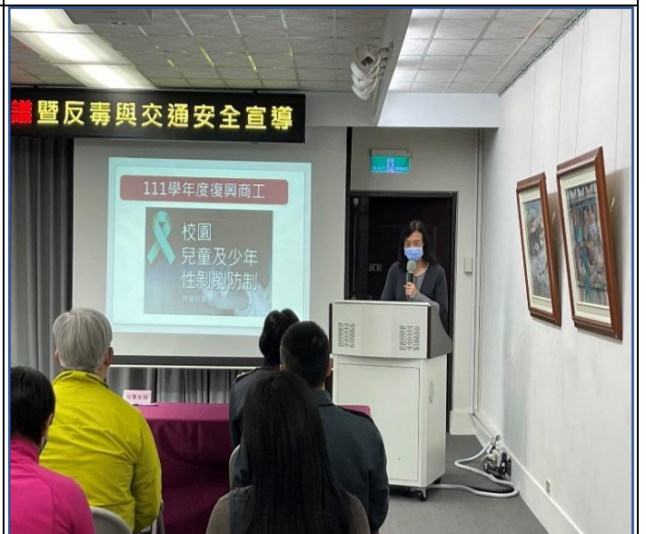
兒少保研習-性剝削