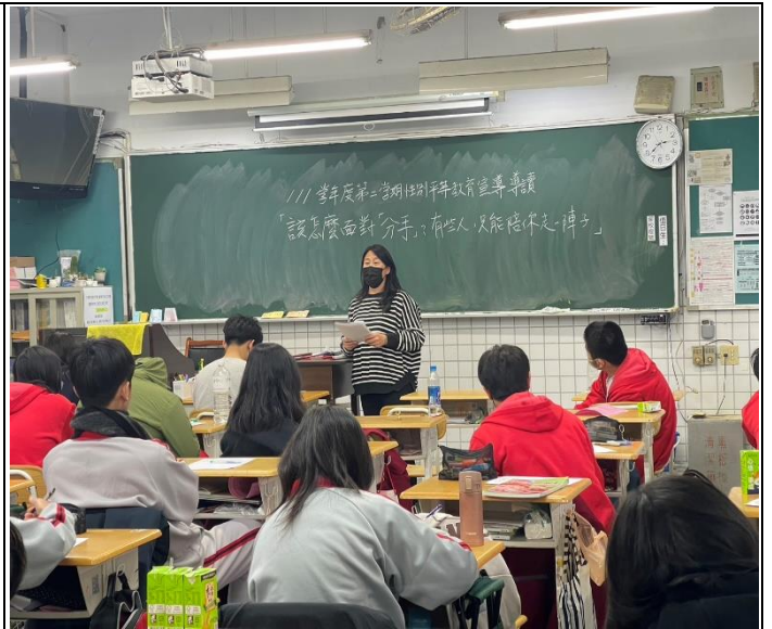
性別文章導讀-該怎麼面對「分手」