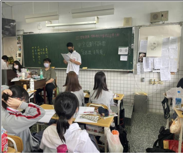
性別文章導讀-拒跟蹤、拒騷擾