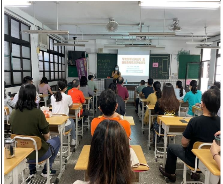
學生關懷技巧與自傷自殺防治