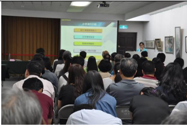
社群運作目標說明