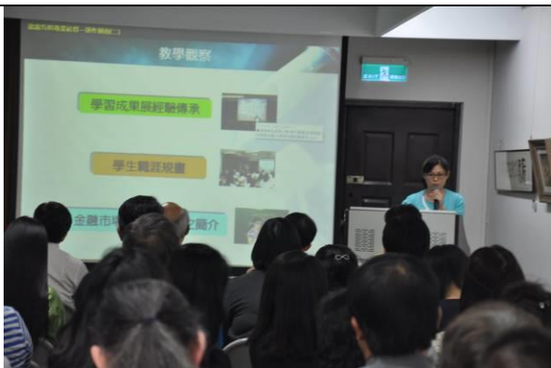
教學觀摩成果說明