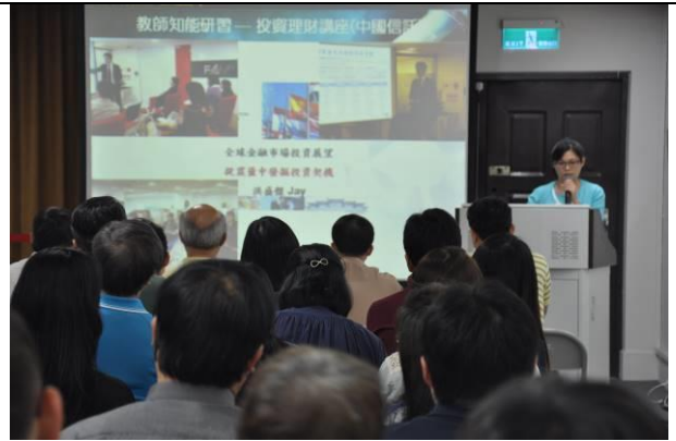
外聘講師投資理財講座說明