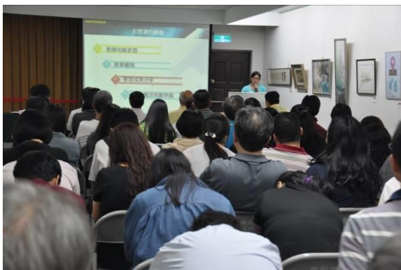
介紹社群運作層面