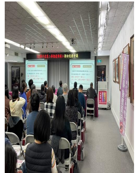
輔導主任宣導兒少性剝削重要性