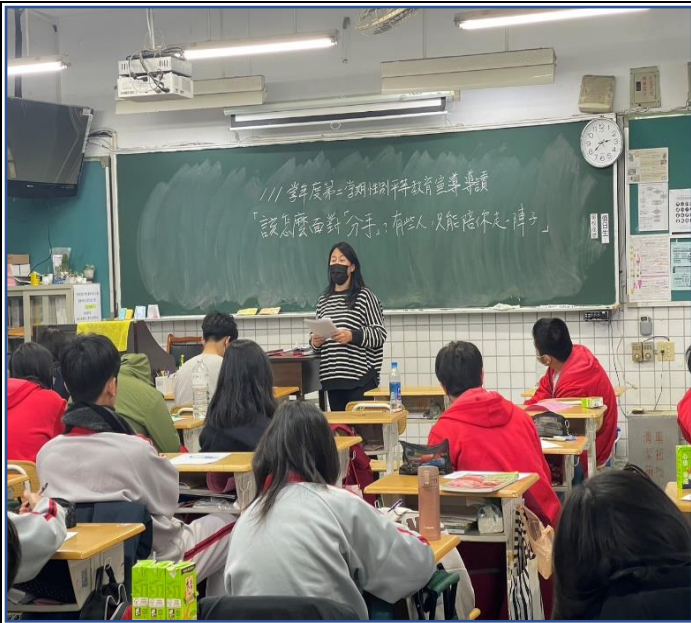
112. 02. 15 性平文章導讀-該怎麼面對「分手」