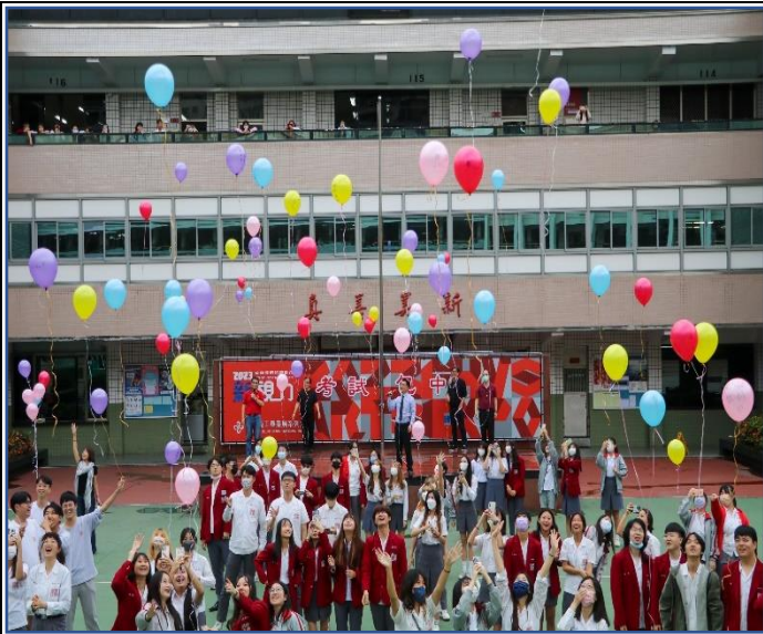
112. 04. 24 包中祈福