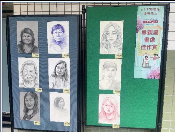
112. 05. 01-112. 05. 07 母親節卡片比賽