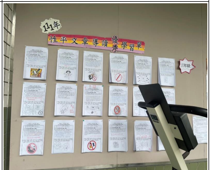
111. 09. 07 性平文章導讀-拒跟蹤，拒騷擾