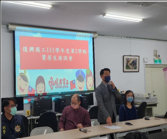
112. 03. 08 賃居生座談