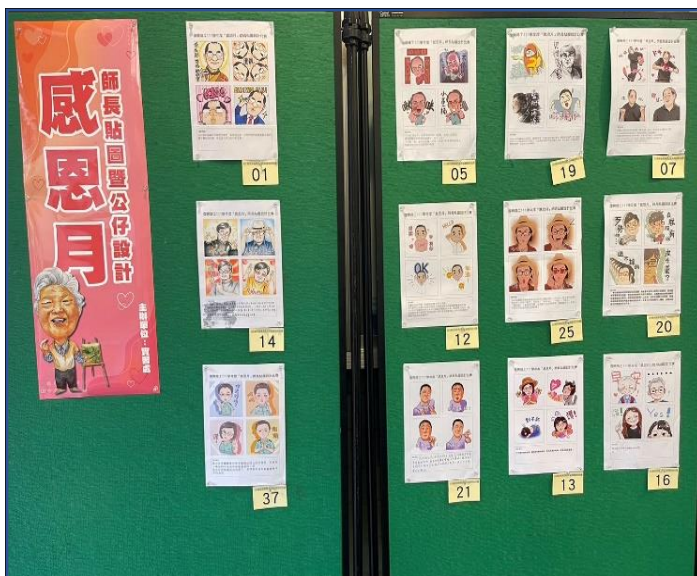
111.11 感恩月-感恩貼圖、公仔比賽