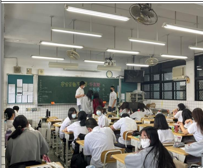
111. 09. 07 性平文章導讀-拒跟蹤，拒騷擾