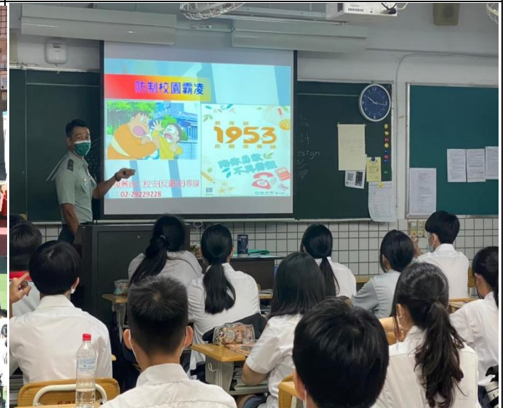
111. 09. 01 友善校園宣導周