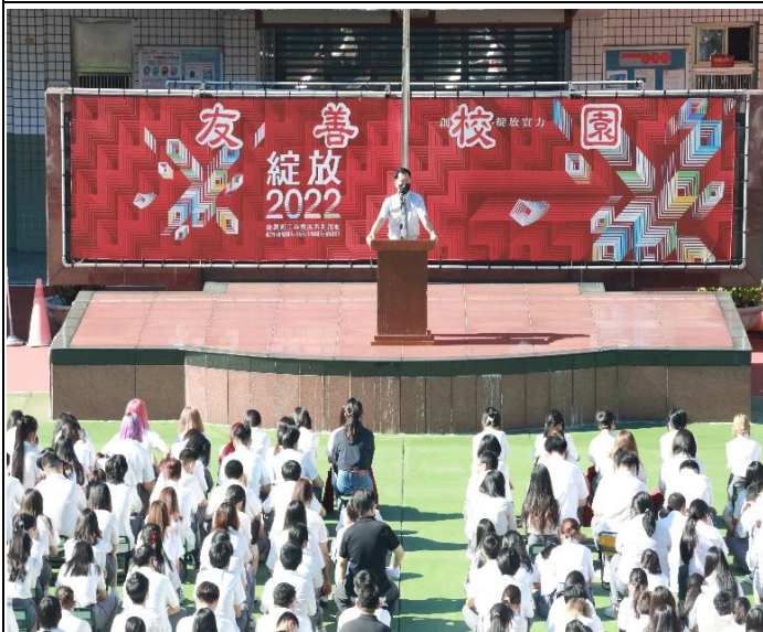
111. 09. 01 友善校園宣導周