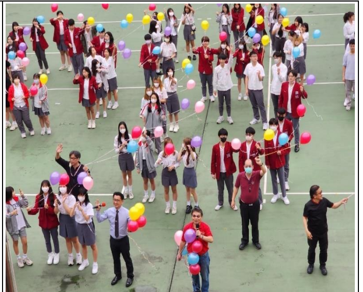
112. 04. 24 包中祈福