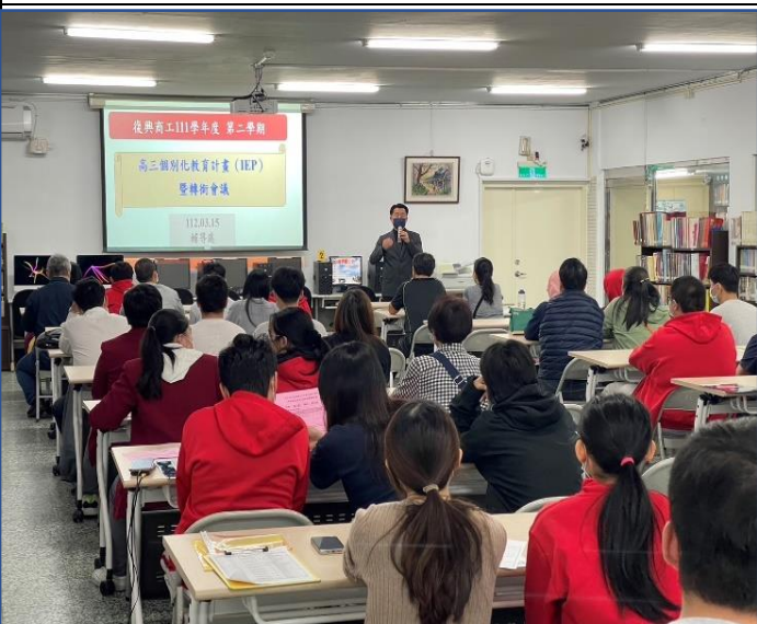
112. 03. 15 高三個別化教育計畫說明會