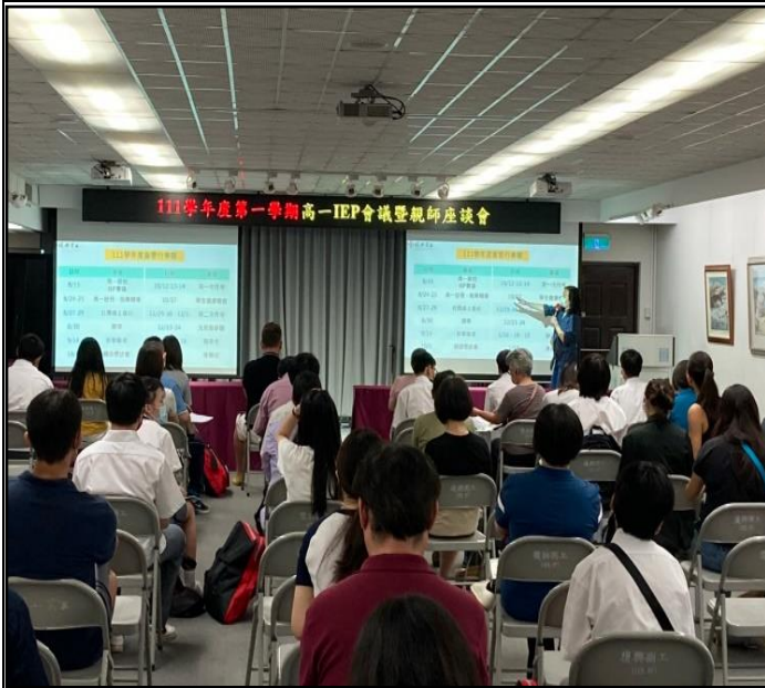
111. 08. 12 特教生家長個別化教育計畫說明會