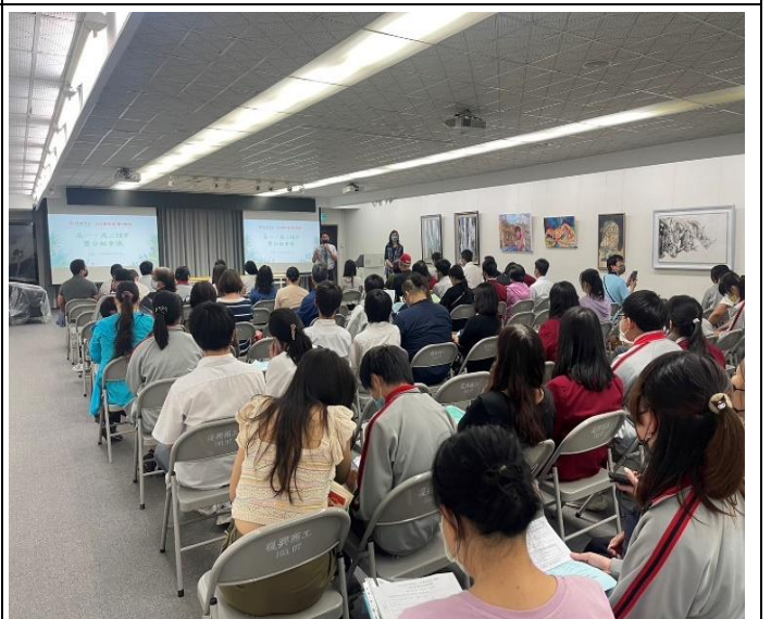
112. 04. 12 高一、高二暨分組說明會