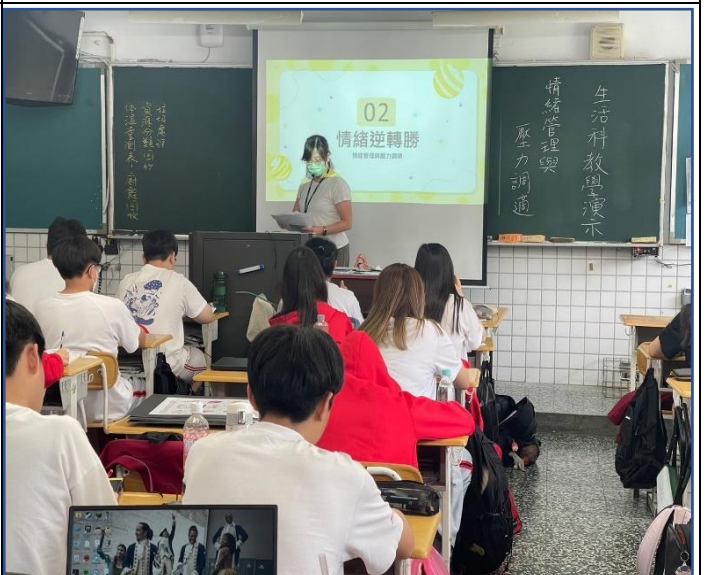
112. 04. 09-112. 04. 22 情緒與壓力調適