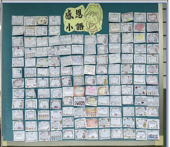
111.11 感恩月-感恩小卡繪製