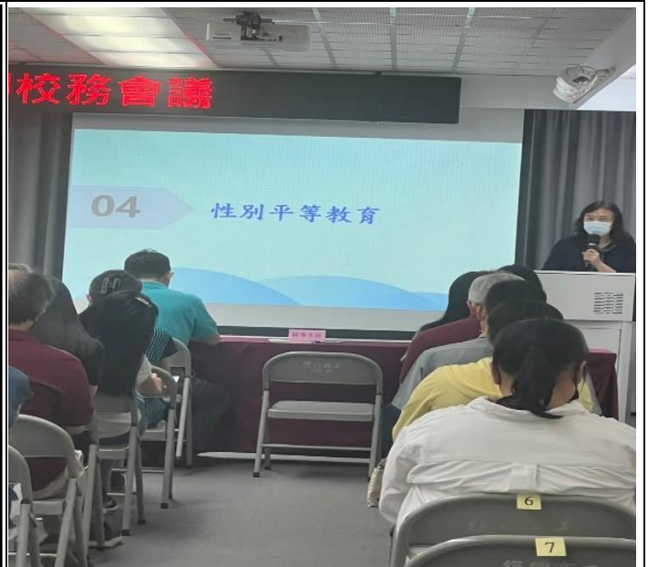
111. 08. 26 全校教師性別平等教育宣導