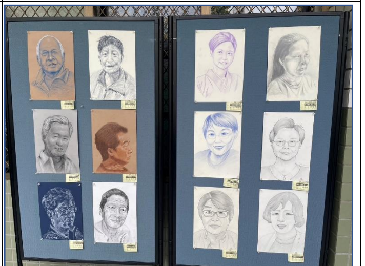
112. 05. 01-112. 05. 07 母親節卡片比賽