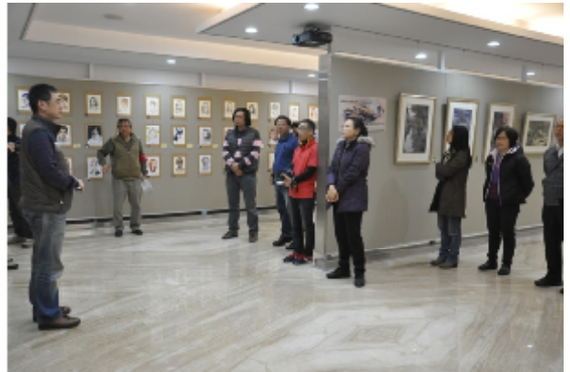
人物繪畫專業培育課程指導教師討論