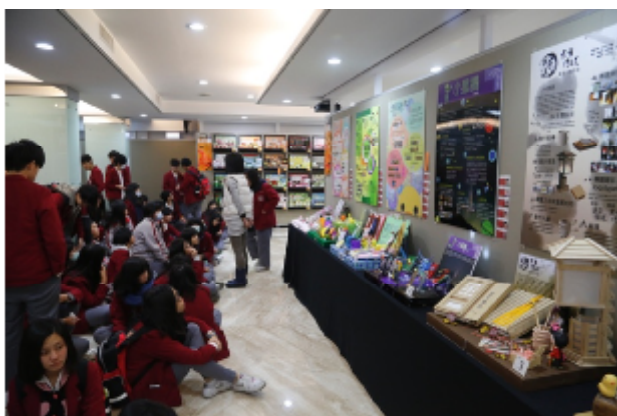
藝術、設計專業展演活動專題製作展出現場