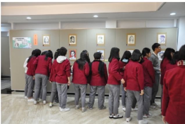
人物繪畫專業培育課程優秀作品展出現場