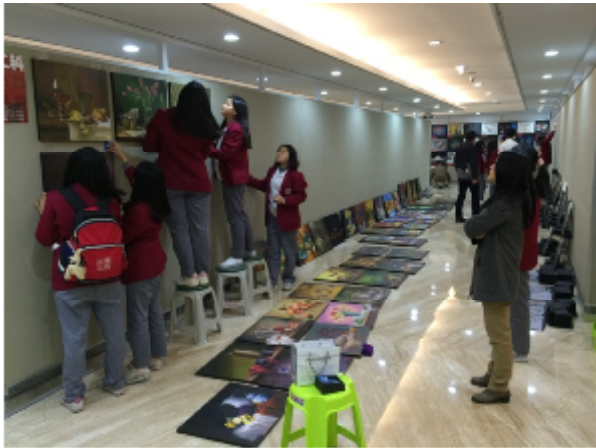
藝術、設計專業展演活動專題製作布展