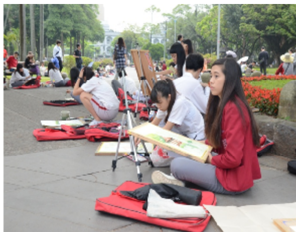
寫生比賽活動現場