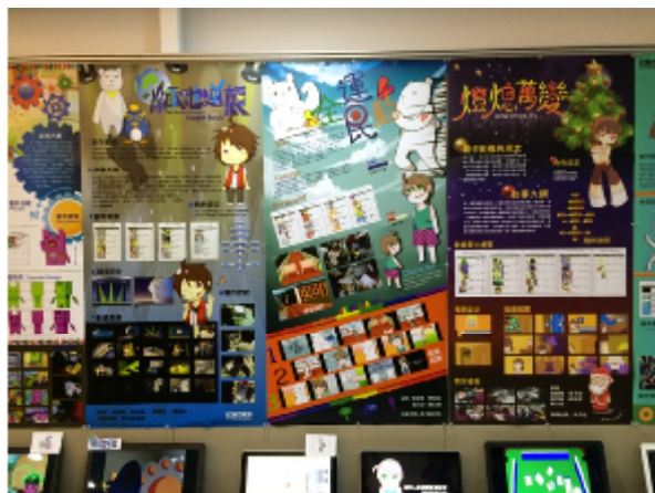
藝術、設計專業展演活動專題製作展出作品