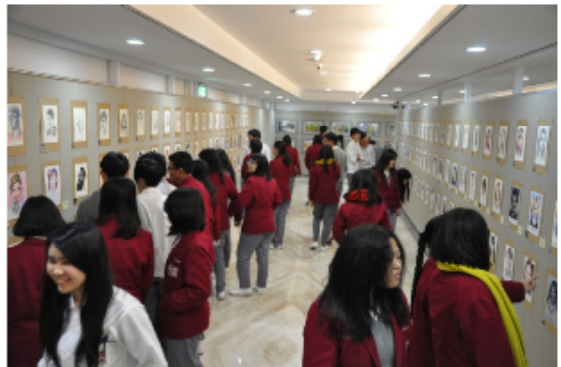
人物繪畫專業培育課程優秀作品展出現場