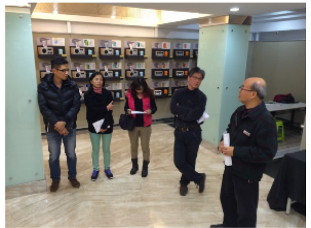
藝術、設計專業展演活動專題製作教師教學探討