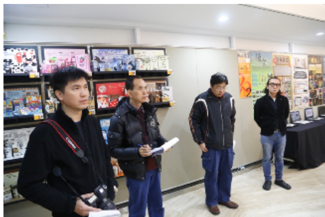
藝術、設計專業展演活動專題製作教師教學探討