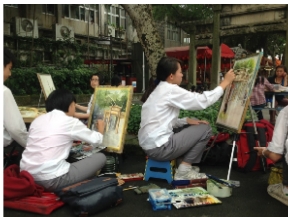
寫生比賽活動現場