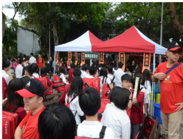
活動服務台與領紙盛況