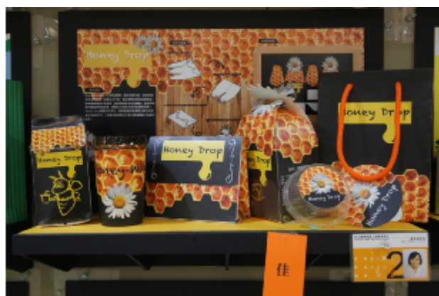
藝術、設計專業展演活動專題製作展出作品