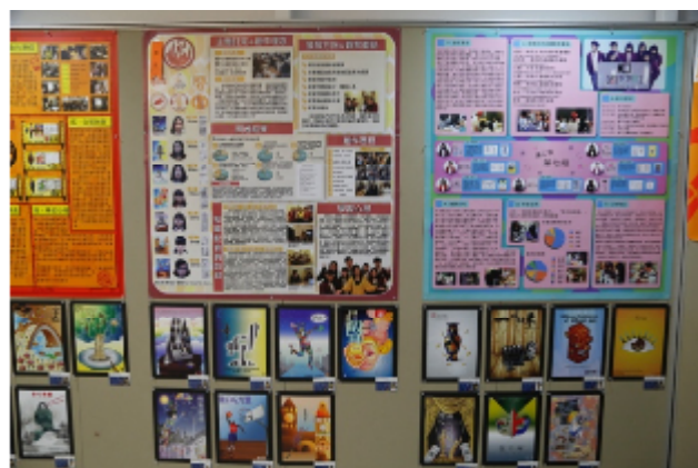
藝術、設計專業展演活動專題製作展出作品