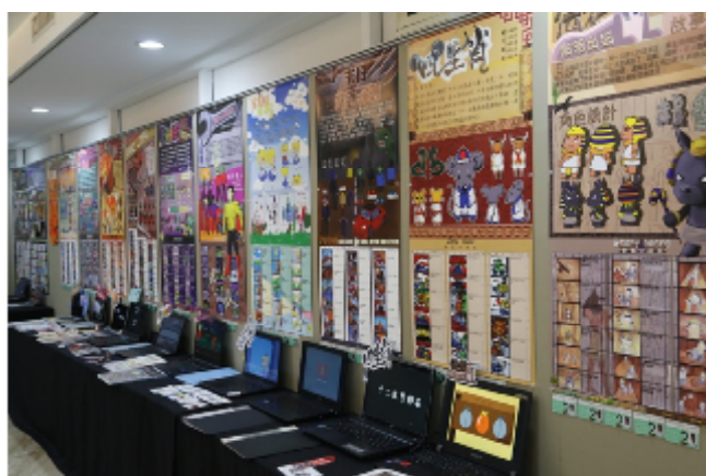
藝術、設計專業展演活動專題製作展出作品