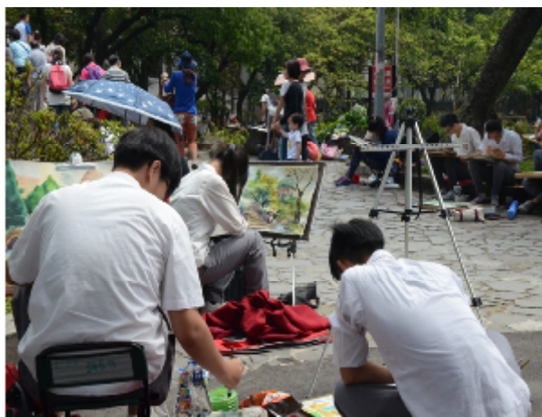
寫生比賽活動現場