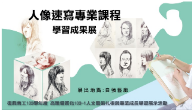
活動作品展出海報