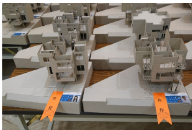
藝術、設計專業展演活動專題製作展出作品