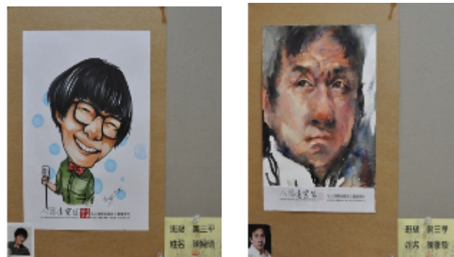
人物繪畫專業培育課程優秀作品