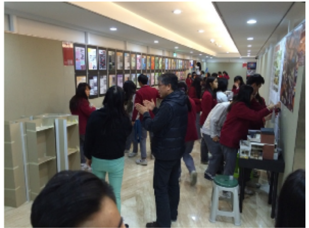
藝術、設計專業展演活動專題製作布展