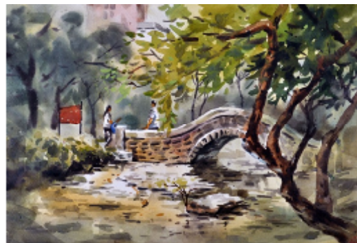
103-1-3 探索自然與文化-全國高中水彩寫生競賽前三名作品