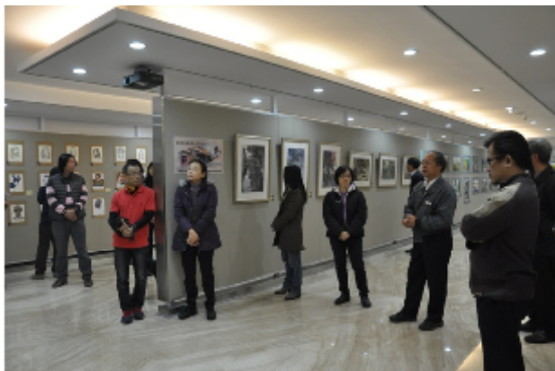
人物繪畫專業培育課程指導教師討論