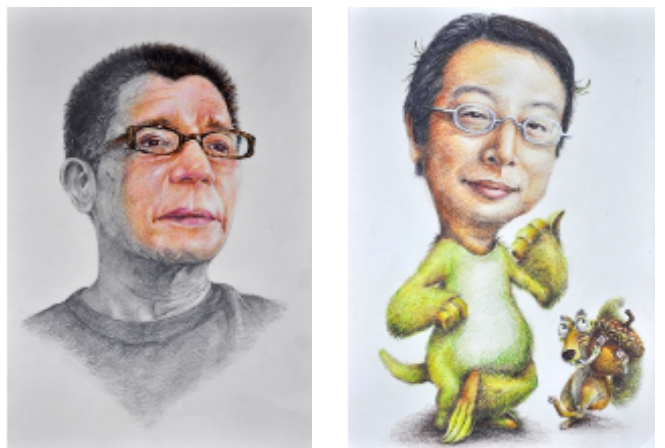
人物繪畫競賽評審與優秀作品