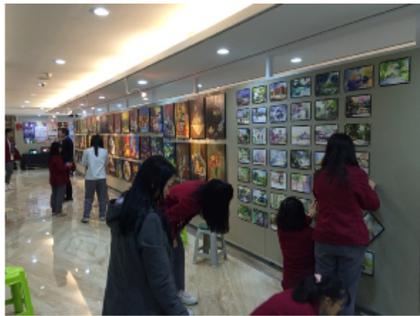
藝術、設計專業展演活動專題製作布展