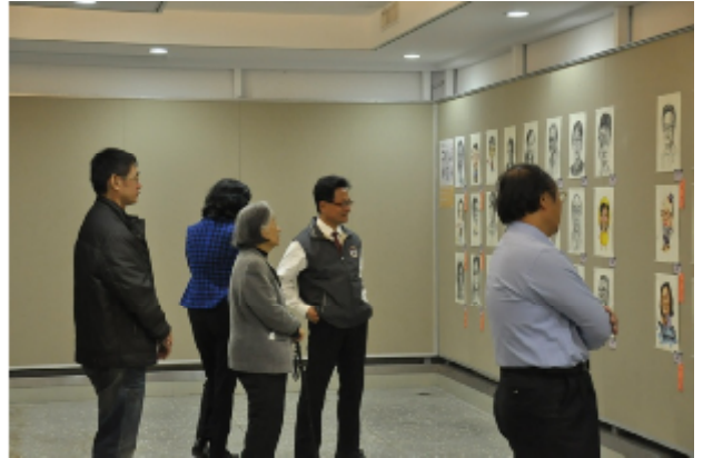
校長與名譽校長蒞臨展出現場指導